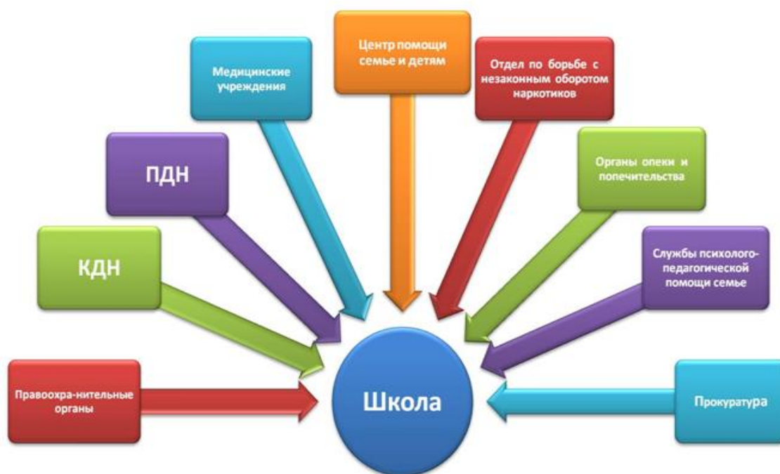
СХЕМА ВЗАИМОДЕЙСТВИЯ СО СЛУЖБАМИ И ВЕДОМСТВАМИ ПО ПРОФИЛАКТИКЕ ПРАВОНАРУШЕНИЙ, БЕЗНАДЗОРНОСТИ И НАРКОМАНИИ СРЕДИ НЕСОВЕРШЕННОЛЕТНИХ

Усилиями классных руководителей данный контингент учащихся активно привлекается к участию во всех классных и школьных мероприятиях. Для более целенаправленной и системной работы по данному направлению в школе создана картотека детей «группы риска» и социально-неблагополучных семей. Психологическое сопровождение детей осуществляется педагогом-психологом. Оно направлено на обеспечение психологического комфорта в процессе обучения и воспитания школьников, на выявление психологических проблем, коррекции развития и поведения.